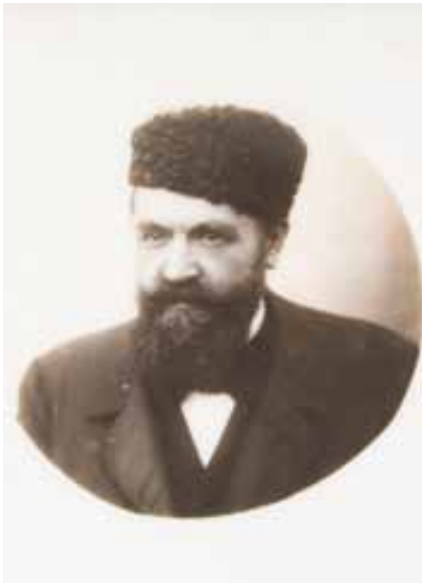
Portrait à la toque d'Astrakan, photographie sur plaque céramique