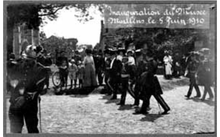
Inauguration du musée le 5 juin 1910