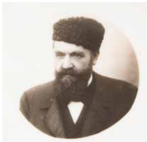
Portrait à la toque d'Astrakan, photographie sur plaque céramique