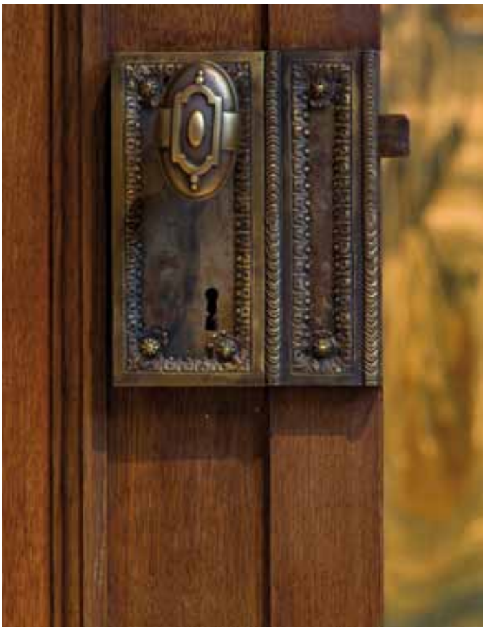
Porte du salon