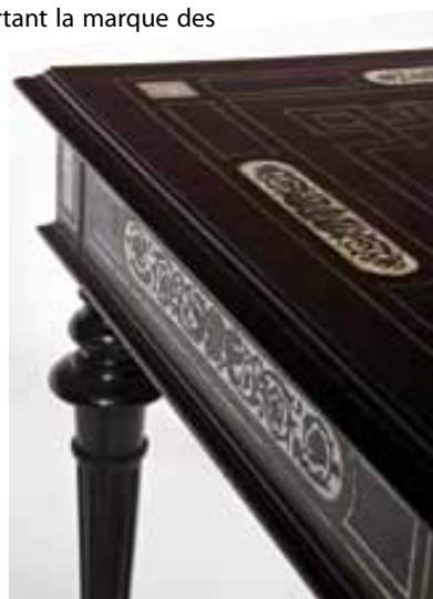
Table, fin du XIX e siècle (après 1889), bois, poirier teinté, palissandre teinté, ébène, incrustation de filets de laiton et d'étain, galalithe marquetée et gravée

La dernière catégorie est formée par le mobilier usuel de la fin du XIX e siècle qui peut être qualifié de « moderne ». Ces meubles se retrouvent facilement dans les catalogues de vente de l'époque. L'ensemble des meubles présentés a nécessité des restaurations spécifiques : renforcement structurel, reprise des placages et des marqueteries, nettoyage des bronzes et des marbres par exemple. Les sièges ont fait l'objet d'une attention particulière et d'une réflexion conduite au cas par cas.