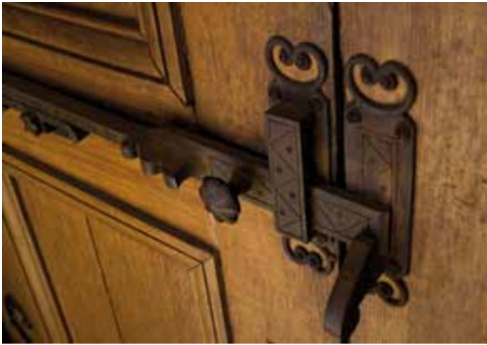
Des ferronneries anciennes réutilisées sur une des portes d'entrée de la maison