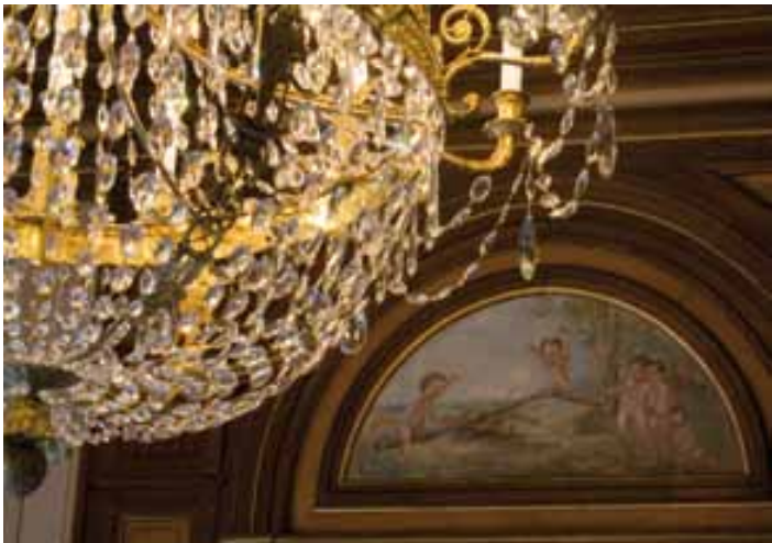
Lustre Empire et dessus-de-porte « Jeux d'enfants », salon, rez-de-chaussée