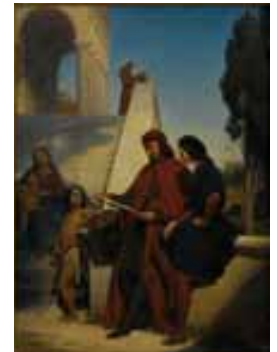
Le Pérugin donnant une leçon à Raphaël Edouard Cibot, huile sur toile, 1842

Avant la création du musée d'art et d'archéologie dans sa configuration actuelle, Moulins a connu plusieurs expériences de collections publiques. Le premier musée municipal, comme dans de nombreuses villes, voit le jour lors de la Révolution française. Face au vandalisme exercé contre les biens de l'aristocratie et du clergé, l'Etat demande aux municipalités de lutter contre le pillage des demeures et églises et de rassembler les objets sauvés. Le district de Moulins nomme donc en 1795 un conservateur qui regroupe ces collections dans la chapelle du couvent de la Visitation. Mais faute de réelle volonté politique, elles seront rapidement dispersées dans divers lieux : églises, lycée... Le 7 mai 1842, le musée de la Ville est créé par délibération du conseil municipal. Quelques toiles appartenant à la Ville au moment de la Révolution ainsi que des dons et des achats forment l'embryon de cette collection. Peu à peu, le musée se déploie dans toutes les salles de l'Hôtel de ville. Les collections sont alors essentiellement composées de peintures et de médailles.