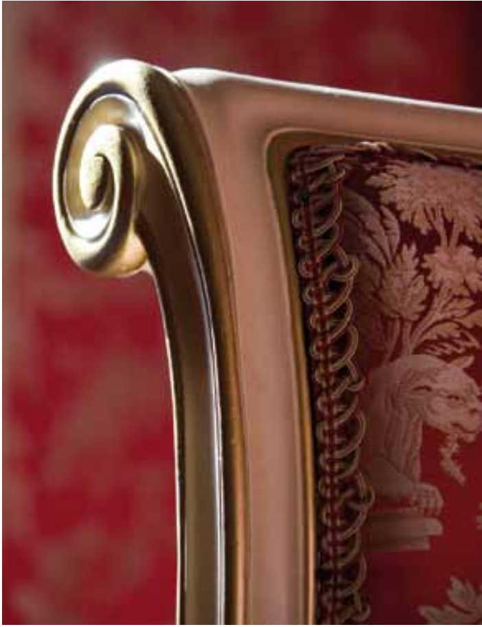
La soie « Les Amours » orne l'ensemble du mobilier de la chambre des Quatre saisons