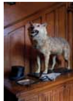
Le vestibule, son coffre gothique et son loup naturalisé

Le vestibule est desservi par une des trois entrées principales, celle donnant accès au jardin Laussedat. Une entrée est également aménagée uniquement pour les domestiques.