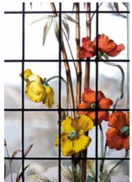
Pavots jaunes et rouges, détail du vitrail, corridor des chambres, 1 er étage