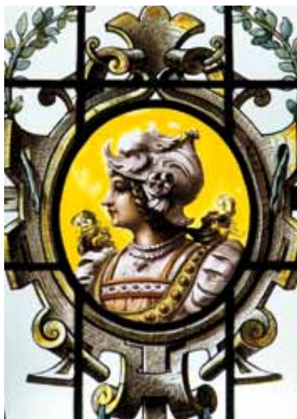
Femme en armure, détail du vitrail, chambre de Louis Martin, 1 er étage

Les vitraux ne peuvent être attribués de façon précise à un verrier. Il semble que plusieurs ateliers soient intervenus. On a cité le nom des frères Tournarel à Paris que René Moreau faisait habituellement travailler. A aussi été évoqué l'atelier de Pierre Guibouret à Moulins qui fit de nombreuses verrières pour les églises de l'Allier. Il y avait alors une longue tradition de peintres verriers dans l'Allier et les départements voisins, mais après 1900 leur nombre a diminué de façon conséquente.