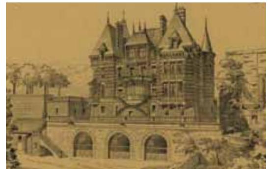
Premier projet de René Moreau

René Moreau présente en 1893 un premier projet de villa dont le dessin est exposé au Salon des Artistes français à Paris la même année. Ce premier jet est sans doute considéré comme trop ambitieux puisque Moreau reprend sa copie et soumet un second projet, moins conséquent mais qui conserve le même style.