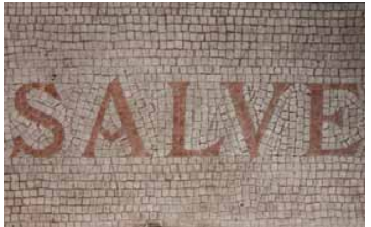
Cette mosaïque salue les visiteurs à l'entrée de la Maison