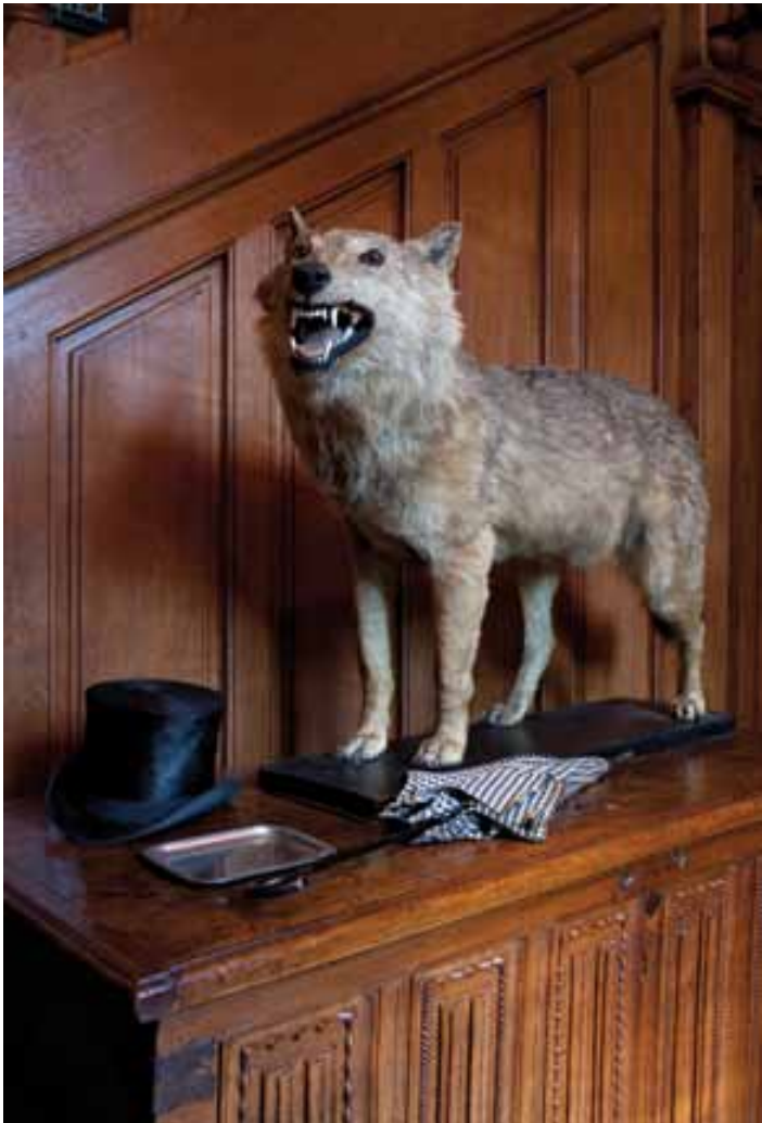
Le vestibule, son coffre gothique et son loup naturalisé