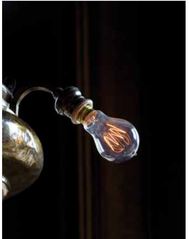
Une lampe d'église ancienne électrifiée par Louis Mantin