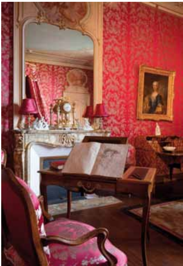
Vue de la chambre de femme