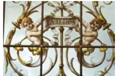
Détail de vitrail, chambre de Louis Mantin

La fin des travaux s'échelonne entre 1895 et 1896. L'inscription de l'observatoire et un vitrail présentent la date de 1895 alors que les peintures décoratives exécutées par Auguste Sauroy consacrent certainement l'achèvement du décor en 1896.