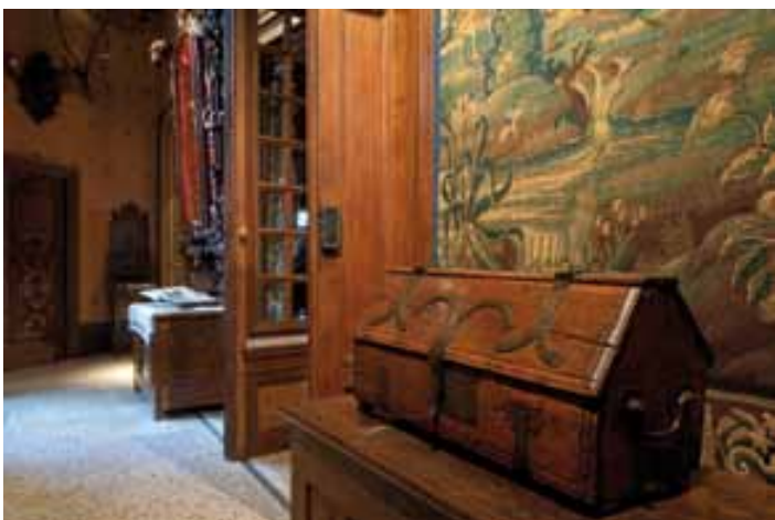
Corridor d'entrée de la Maison