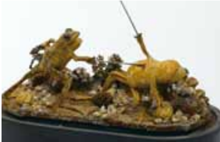
Duel de grenouilles naturalisées présenté sous un globe, Revil (naturalisateur), Paris, XIX e siècle