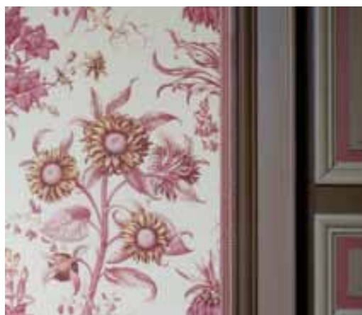
Le lin imprimé « Les Tournesols »