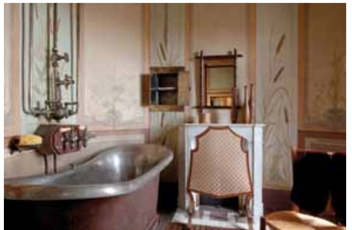
La salle de bain