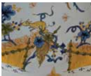
Assiette, faïence stannifère à décor de grand feu polychrome, Moulins, vers 1750