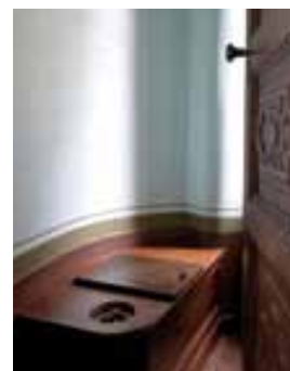
Les toilettes du 1 er étage

Chaque étage de la maison est équipé de toilettes. La cuvette en faïence blanche est encastrée dans un meuble en bois. La chasse d'eau emprunte le système de la pompe utilisé couramment sur les navires.