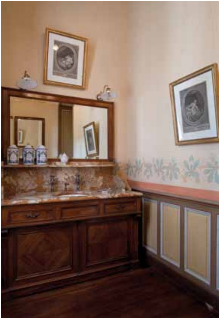
Le cabinet de toilette