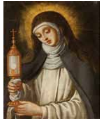
Sainte Claire, école espagnole, huile sur cuivre, 1 ère moitié du XVII e siècle, coll. cathédrale Notre-Dame de Moulins