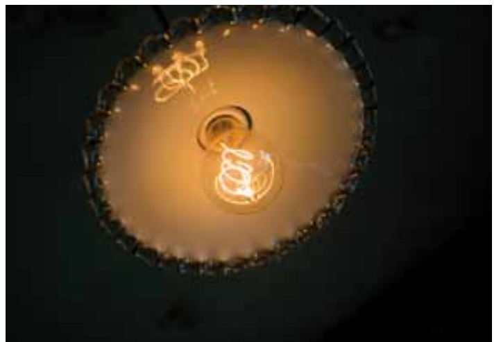
L'éclairage 1900 est conservé