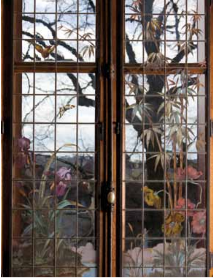
Vitrail influencé par le mouvement Art nouveau : bambous, iris, roseaux... corridor des chambres, 1er étage