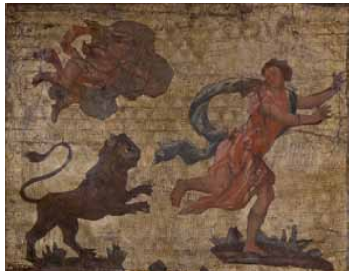
Tysbée retournant à la fontaine pour retrouver son amant