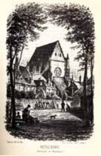
Vue de la collégiale depuis la parcelle achetée par les grands-parents de Louis Mantin (la cathédrale ne sera construite que dans les années 1850)

L'emplacement de la Maison Mantin est loin d'être anodin. L'actuelle maison est construite sur une parcelle qui se situe à la place de la partie nord du corps de logis construit au XVe siècle par les ducs de Bourbon, entre le château médiéval et le pavillon royal Renaissance. Un incendie ravage en 1755 une partie de ce bâtiment qui avait été par ailleurs progressivement laissé en déshérence. Ce terrain, situé sur un dénivelé, possède encore, du côté des Jardins-Bas, les salles basses voûtées du XVe siècle. Cet emplacement est donc fortement lié à la fabuleuse histoire des Bourbon, au milieu de ce château de Moulines, ville capitale du Bourbonnais.