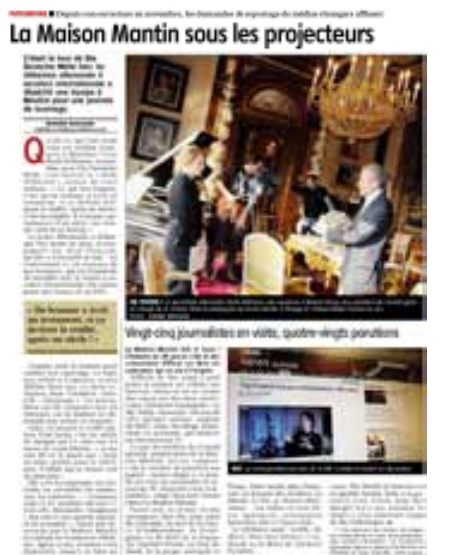
Journal d'Allier - OCT. 10 Mensuel - Surface approx. (copr) : 396