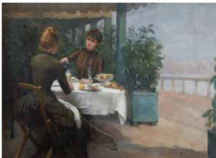
Dîneuses ou Goûter à la terrasse, Paul Chocarne-Moreau (Dijon, 1855 - Neuilly-sur-Seine, 1930), 1885, huile sur toile