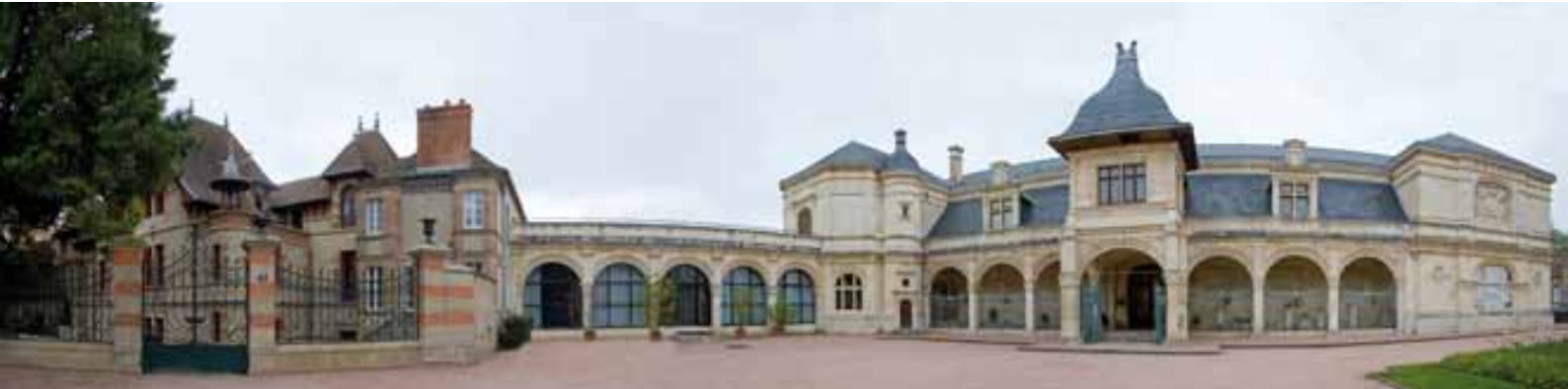
Vue panoramique de la Maison Mantin (à gauche) et du musée Anne-de-Beaujeu (à droite)

Le musée Anne-de-Beaujeu, patrimoine du Conseil général de l'Allier, est le fruit de plusieurs héritages : celui des ducs de Bourbon d'abord, des dernières volontés d'un Moulinois de naissance, Louis Mantin, de la passion des membres d'une société savante locale, mais aussi de la pratique philanthropique du don d'oeuvres d'art, d'une politique d'acquisition soutenue et surtout de la volonté des pouvoirs publics.