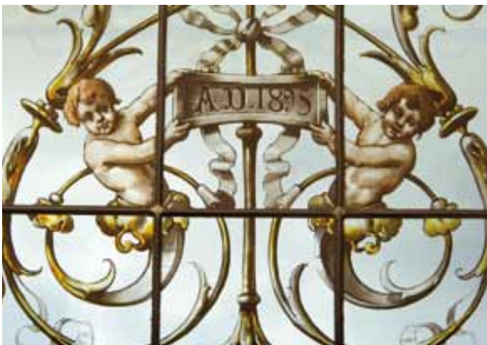
Détail de vitrail, chambre de Louis Martin