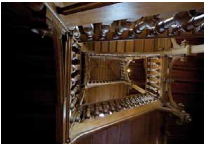
La cage d'escalier vue du rez-de-jardin. La tradition familiale d'ébénisterie a sans doute joué dans l'utilisation à profusion du bois.