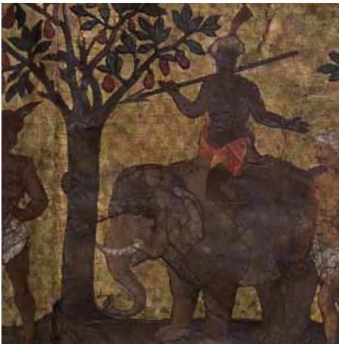
« Cortège d'un Roy chinois », garde armé et coiffé d'un turban sur un éléphant