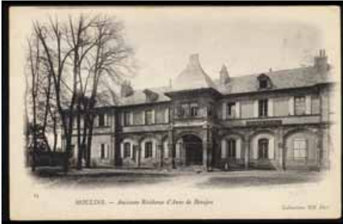
Le pavillon Anne-de-Beaujeu abrite la gendarmerie - Photographie prise avant 1907

Cette clause testamentaire est donc un « stimulant efficace » : la gendarmerie quitte le pavillon Renaissance en 1907, la municipalité emprunte pour faire aboutir rapidement le projet et le musée est inauguré le 5 juin 1910.