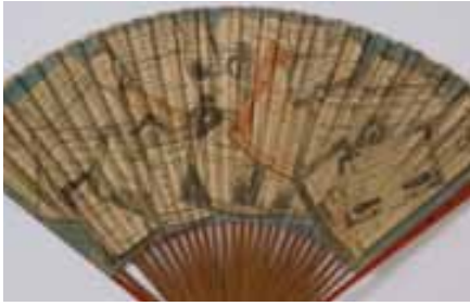
Eventail « aux Assignats », France, vers 1792, eau-forte noire, bleue et rouge sur papier, bois laqué, os