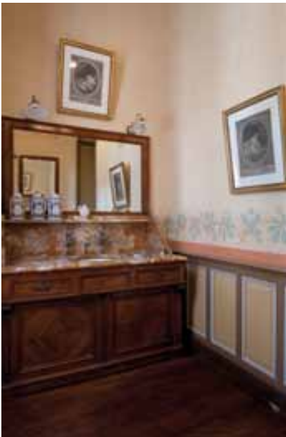
Vue du cabinet de toilette

Cette pièce de transition était tendue d'une toile de lin imprimé (cf. les étoffes d'ameublement p.10). Ce tissu, très abîmé et qui ne pouvait être restauré, a été refait à l'identique en combinant technologie de pointe et savoir-faire traditionnel. Une belle commode marquetée Régence et des panneaux en bois sculptés de fleurs agrémentent ce passage.