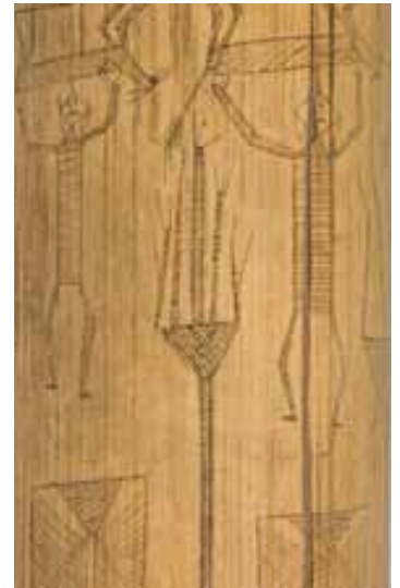
Bambou gravé kanak, Nouvelle-Calédonie, tige de bambou gravé, XIX e siècle,

Comment s'explique alors la présence inattendue d'un bambou gravé kanak authentifié très récemment ? Témoigne-t-il des échanges qui se pratiquaient entre collectionneurs ? Est-ce un présent de choix offert à la curiosité insatiable de Louis Mantin ?