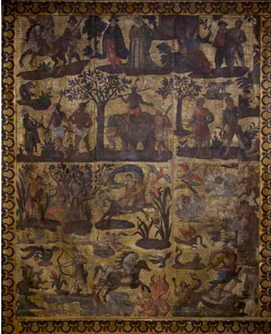
Un des murs tapissé de cuirs dorés de la chambre de Louis Mantin : - partie supérieure, « cortège d'un Roy chinois avec sa cour et ses gardes », - partie inférieure, allégories de la Terre, du Feu et de l'Eau