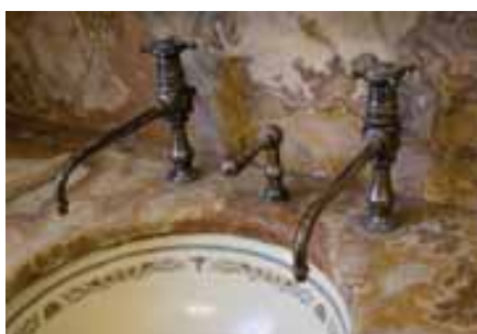
Le meuble de toilette

La Maison Mantin est la première maison privée électrifiée de Moulins. L'électricité y est utilisée uniquement pour l'éclairage.