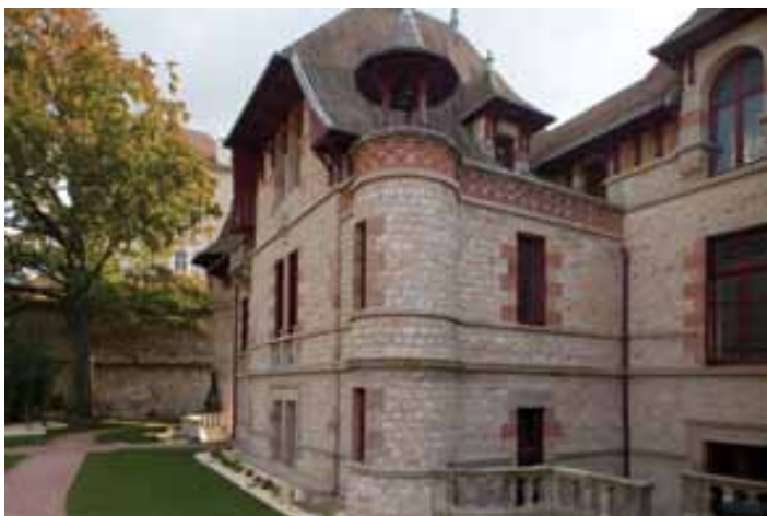
Façade avant (est) de la Maison Mantin