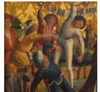
Retable de Saint-Etienne (détail) , attribué au maître d'Uttenheim et à Michaël Pacher, vers 1470