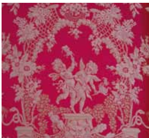
La Soie « Les Amours »

Le lin imprimé « Les Tournesols » est, quant à lui, édité en 1894 par l'entreprise Scheurer-Rott & Fils, installée à Thann, non loin de Mulhouse, à partir d'une gravure du XVII e siècle. Le tournesol encadré du lys pourpre et de la couronne impériale, sont des références autant historiques que botaniques. L'atmosphère que véhicule ce décor évoque l'émerveillement éprouvé à feuilleter les vieux ouvrages des savants d'autrefois.