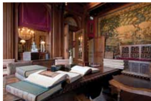
Vue du bureau

faïence colorés d'une guirlande de fruits et sur le manteau, d'un tableau en faïence de Delft où, dans un camaïeu de bleus, un canal est bordé d'arbres. Deux statuette religieuses sont présentées dans des niches de part et d'autre. La plaque de l'âtre est ornée d'un monumental « M » accosté de deux ailes déployées (rébus pour l'initiale de Louis). Une tapisserie, appartenant sans doute à la même tenture que celles présentes dans le corridor et le salon, représente ici une chasse au cerf. Ces scènes, évocation des chasses royales et seigneuriales, étaient très appréciées de la clientèle et furent abondamment tissées. Le bureau utilisé par Louis Mantin est une table dite « à patins » du XVII e siècle.