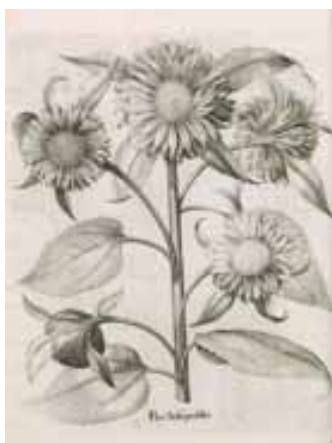
Hortus Eystettensis de Basileus Besler ; planche 206 : le tournesol ; Nüremberg, 1613 ; gravure au burin sur papier