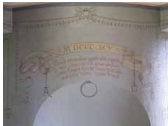
Inscription latine peinte sur le mur de l'observatoire