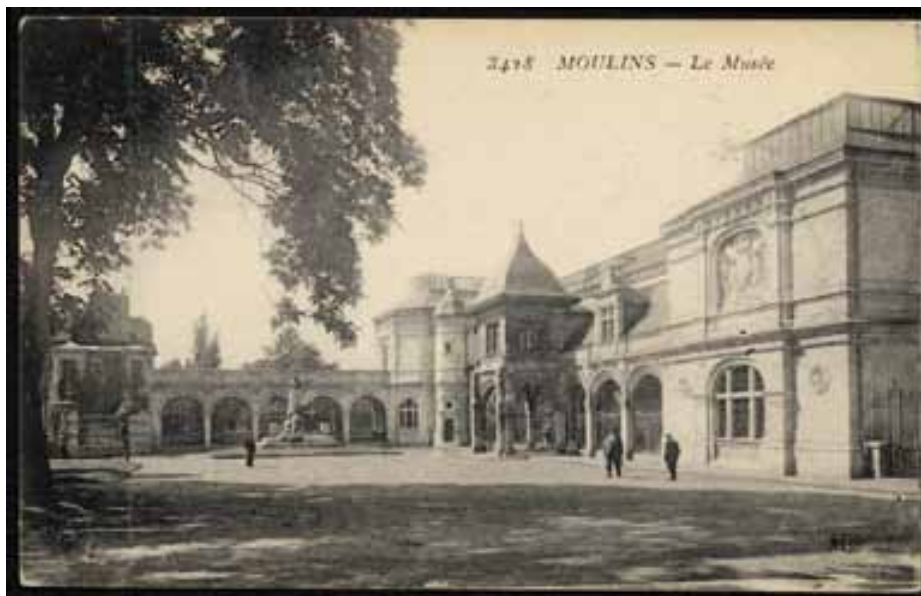
Une galerie relie le musée et la Maison Mantin - Photographie prise après 1911