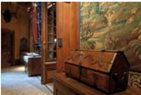
Corridor d'entrée de la Maison

Une porte permet l'accès direct depuis la terrasse.