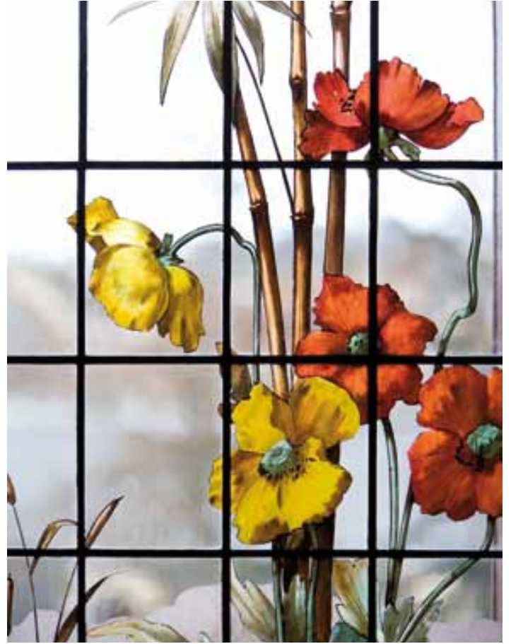
Pavots jaunes et rouges, détail du vitrail , corridor des chambres, 1er étage