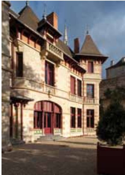
Façade arrière (ouest) de la Maison Mantin