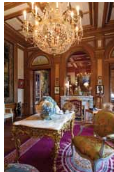
Vue du grand salon

Ce salon d'apparat, de forme carré, comporte un plafond à caissons, blancs et or, ornés de couronnes de feuilles de chêne et de glands rehaussés d'or. Un important lustre Empire à pampilles de cristal et à palmettes en bronze doré cache trois ampoules tricolores ! Mantin manifestait-il ainsi son attachement à la Patrie à une date où la défaite de 1870 – et la perte de l'Alsace et de la Moselle – était dans tous les esprits et rassemblait l'ensemble des Français dans un désir national de revanche ? Une grande baie vitrée, donnant directement sur la terrasse par une volée de marches, est équipée de volets métalliques. Une manivelle, actionnant une vis sans fin, permet de manoeuvrer les volets de la partie supérieure. Une tapisserie marchaise (fin du XVII e ou début du XVIII e siècle) à décor de chasse au sanglier décore le mur opposé. La cheminée de marbre gris est surmontée, non d'un miroir, mais d'un simple vitrage alors que les portes présentent des miroirs. Un jeu de lumières, de transparences, de surprises naît de cet aménagement original. Les dessus-de-porte sont animés de putti dans des scènes champêtres.