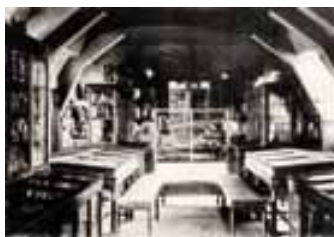
Vue du musée - salle du palais de justice