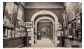
Salles des tableaux - carte postale ancienne