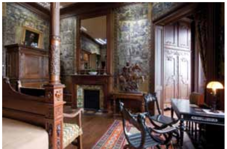
Vue de la chambre de Louis Mantin

Un lit à colonnes supportant un dais plat occupe une grande partie de la pièce. Meuble de la fin du XIX e siècle, il s'inspire des lits de bout apparus aux XV e ou XVI e siècle. Entièrement fermé par des tentures, il est caractéristique du lit « fermé » dit « à la française » comme il se présentait au XVII e siècle.