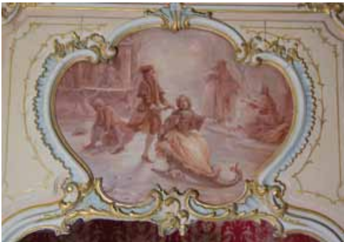
Dessus-de-porte « L'hiver », chambre des Quatre saisons