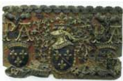
Bas-relief aux armes des Bourbon, bois polychrome et doré, fin du XV e - début du XVI e siècle

Les ducs de Bourbon, notamment Pierre et Anne de Beaujeu ont été de grands mécènes. Ils se sont entourés des meilleurs artistes de leur temps pour donner au duché des bâtiments dignes de son rang. Les grands chantiers qu'ils entreprirent sur l'ensemble de leur territoire attirèrent architectes, peintres, sculpteurs, vitraillistes. Un espace est donc consacré à cet art de la cour bourbonnaise. Il présente notamment :