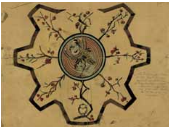
Dessin à l'aquarelle de René Moreau pour la mosaïque de l'observatoire

Moi qui fus autrefois une faible partie d'une demeure considérable et orgueilleuse, voilà que je parachève une habitation bizarre : je fus naguère détruite par le feu ; ce que le temps qui dévore tout relève aujourd'hui, demain le temps l'aura de nouveau détruit.