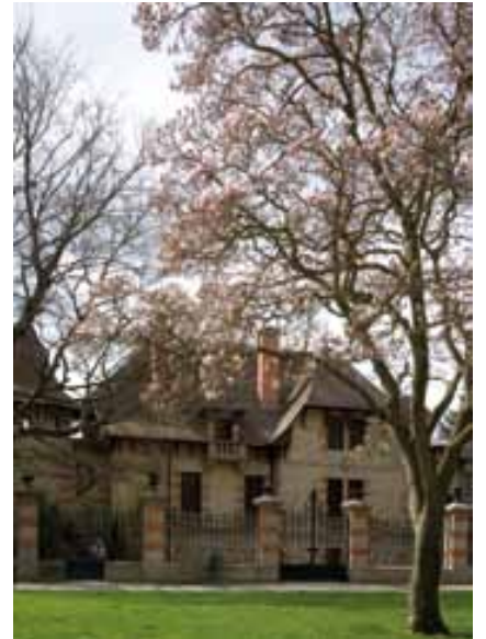
Vue de la Maison Mantin du parc Laussedat, Moulins