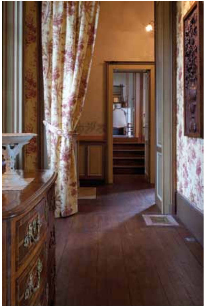
Le passage « Aux tournesols »