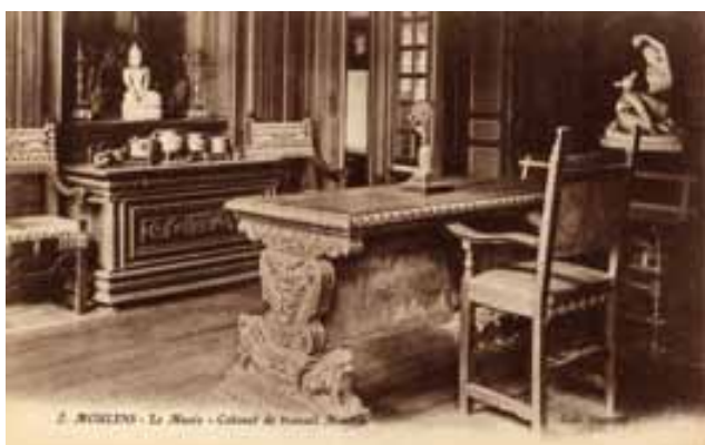
Le bureau dans les années 1920, carte postale