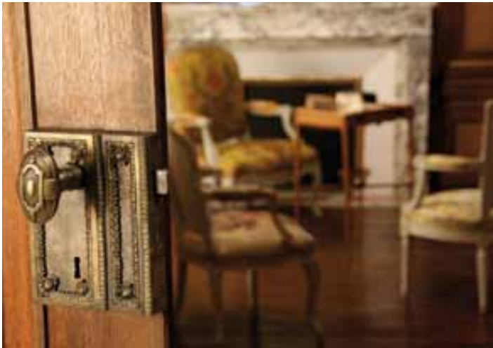
Coup d'oeil sur le salon