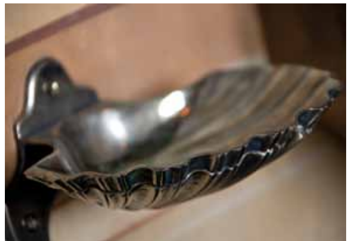
Porte-éponge, salle de bain