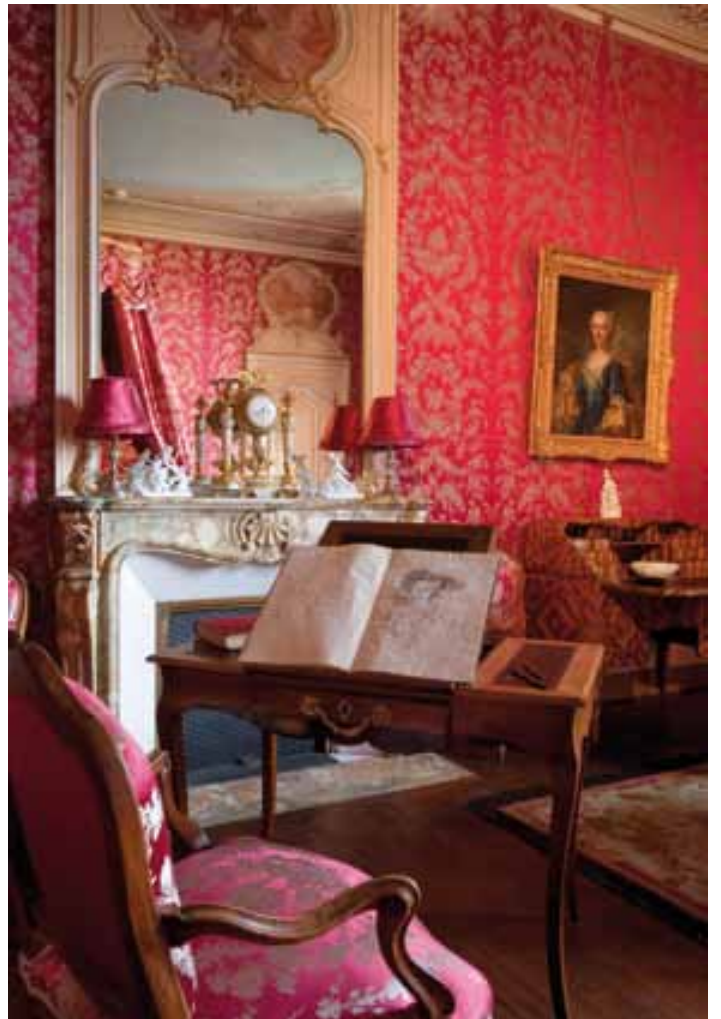
La chambre des Quatre saisons