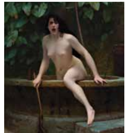
La Vérité , Jean-Léon Gérôme, huile sur toile, 1896