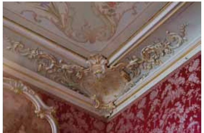
Détail d'un écoinçon stucqué du plafond