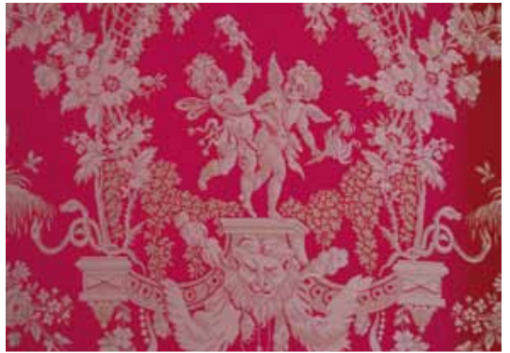
La Soie « Les Amours »