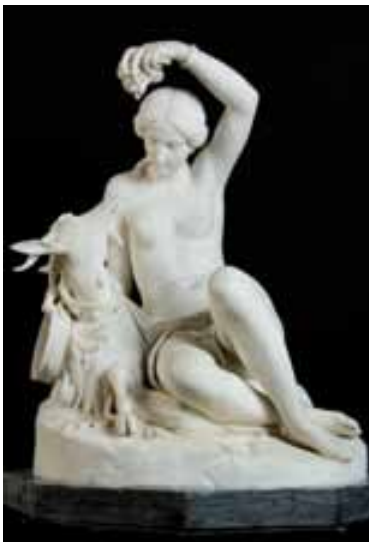
Esméralda, Tommaso II Solari (Naples, 1820-id., 1897), marbre, 1863

Louis Mantin partage ses biens entre la Ville de Moulins, la cathédrale Notre-Dame de Moulins et une proche parente. Par ailleurs, certains objets sont donnés expressément à des amis et ses ouvrages rejoignent la bibliothèque de l'Ordre des avocats de Moulins.