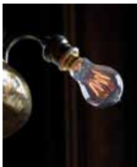
Une lampe d'église ancienne électriée par Louis Mantin

En adjonction des nombreuses cheminées, un chauffage par air chaud est installé. Cette technique a souvent été adoptée dans les églises dans la seconde moitié du XIX e siècle. Un calorifère à charbon chauffait l'air qui ressortait par des bouches en plusieurs endroits de la maison. Lors des travaux de rénovation, il est apparu que cet « aéro-calorifère » ne pouvait malheureusement pas être réutilisé, ce qui a conduit à l'installation de radiateurs en fonte reliés à un chauffage central.