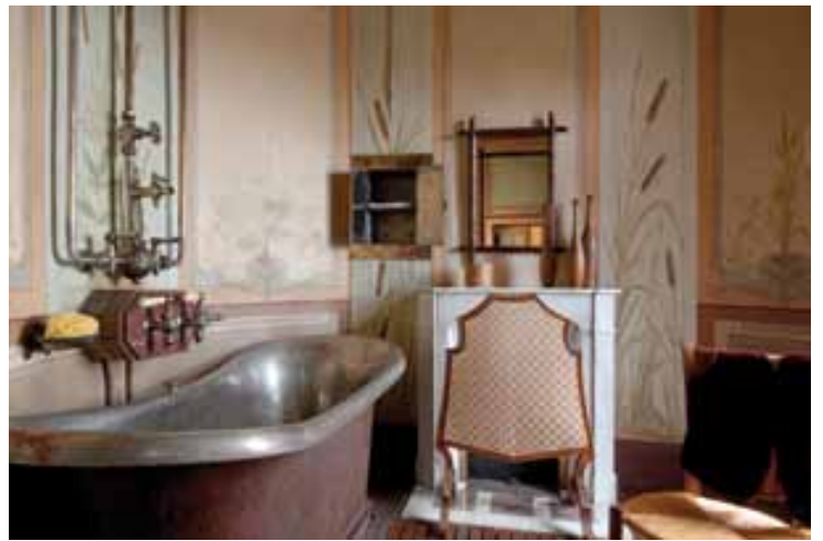
View of the washroom

La salle de bain, de forme hexagonale, propose des aménagements ultra modernes pour l'époque : une baignoire en cuivre étamé alimentée en eaux chaude et froide, une douche et un petit placard branché sur un dispositif permettant de chauffer les serviettes. Le sol est recouvert d'un caillebotis. Au-dessous, une feuille de