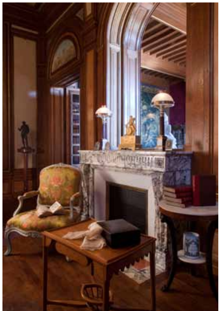
Vue du salon, rez-de-chaussée (en cours d'aménagement)