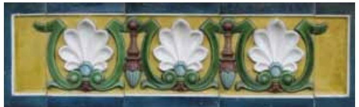
Décor de terre cuite émaillée polychrome sur la façade « ouest » de la Maison Mantin

La Maison Mantin présente un plan asymétrique sur trois niveaux. Elle se caractérise par de nombreux décrochements, des tourelles, des baies de formes variées. Les toits débordants sont couverts de tuiles plates et les pignons sont coupés. Les parements sont construits en pierre aux joints cimentés. Des moulurations horizontales en pierre taillée scandent les étages. Les ouvertures présentent des encadrements en pierre plus claire et en briques. Un décor de terre cuite émaillée polychrome agrémenté les façades.