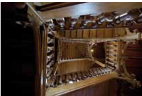
La cage d'escalier : la tradition familiale d'ébénisterie a sans doute joué dans l'utilisation à profusion du bois.

L'escalier fait le lien entre la partie conservée de la maison familiale et la construction neuve. Il est le pivot de la maison et dessert tous les étages. En bois foncé ciré, l'escalier est spacieux et tourne à angles droits. Les murs sont recouverts en partie basse de lambris cirés alors que la partie haute est peinte de couleur ocre sur un crépi gratté. Le long des lambris, court un décor peint de rinceaux et de feuilles stylisées. Au premier niveau, dans le vestibule, ce décor est agrémenté de deux aigrettes dont les plumages arborent des reflets bleus et roses. La cage d'escalier est coiffée d'une voûte en croisée d'ogives, entièrement lambrissée de bois, qui depuis le rez-de-jardin, offre une vue vertigineuse. L'escalier est éclairé par de grandes fenêtres ornées de vitraux. Des tapis anciens sont jetés sur les rambardes. Un grand tableau dépeint les membres de la famille Mantin. Le jeune garçon, à droite, est le père de Louis Mantin.